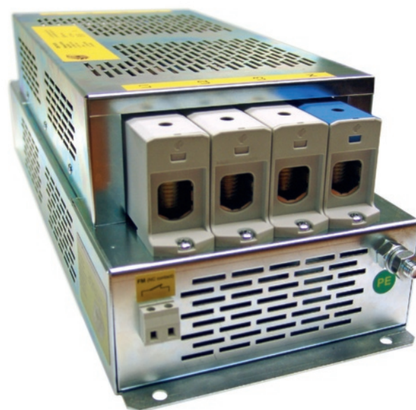
Zotup dispone di 4 brevetti internazionali nelle protezioni da sovratensioni per i circuiti di alimentazione in bassa tensione